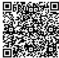
広島入国管理局岡山出張所地図 QR コード